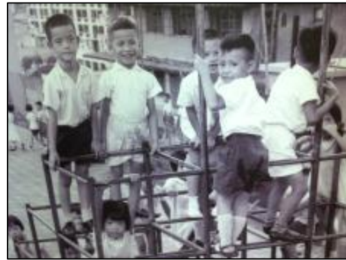
展館照片所見的兒童於屋邨公眾地方玩樂的情況

上世紀中期，草根階層子弟接受教育的機會有限，即使能夠入學，學習環境及條件亦欠理想。展館內有屋邨天台小學，以及在設施簡陋課室上課的相片，可以反映當年的教育情況。然而這種外在困難及挑戰，無礙當時的學童力求上進，爭取出人頭地的機會 9 ，可視為知識改變命運的典型例子。學生可從這些相片或回憶文字當中，認識香港教育的發展歷程，並以求學機會及學習環境為重點，了解教育機會對於提升香港人生活素質的影響。