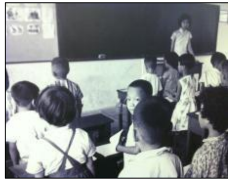
展館照片所見學生於天台小學及簡陋課室上課的情況

從展館照片及展品所反映的屋邨居民日常生活，未必如居住環境單位內的實物擺設般那麼具體地展示當時情況，但仍可作為了解香港居民生活素質變化的參考資料。然而由於展品以相片為主，故學生在參觀之後要多利用文獻輔助，才可以有較為全面的認識。