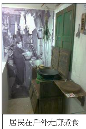
居民在戶外走廊煮食

美荷樓屬「H型」公共房屋，大廈中座是公共浴廁及洗滌的地方，而在兩側長形雙翼之間所形成的兩個天井，是居民的主要活動場所，用作休憩納涼之處。整座大廈共有四條位於首尾兩方的樓梯，居民往來都需要途經鄰居家門。而且由於單位面積狹小，居民經常利用走廊擺放雜物，並在走廊設置廚櫃生火煮食，夏天晚上更會搬出帆布床在走廊睡覺 12 。這種建築特色，毋庸諱言會對居民生活帶來頗多不便；而共用公共衛生設施，就更可能引起居民之間的磨擦和爭執。然而另一方面，這些建築特色促進住戶之間的接觸和了解，有助培養鄰里關係。同時亦由於最初搬進石硤尾邨的居民，大部分都是石硤尾火災的災民，這些共同經歷，亦令大家長久維繫睦鄰網絡。以下為一些居民的回憶片段：