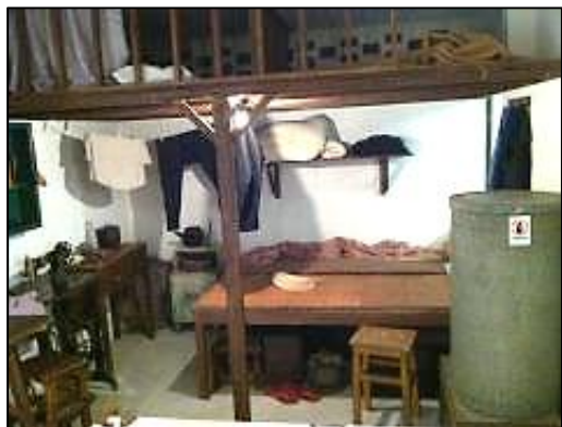
1950年代落成初期的公屋單位

貧窮生活，似乎注定如此。晚上一家八口睡在兩張碌架床，……（父母）要睡覺，得把竹蓆鋪在地板，明天一早起床就把竹蓆捲好，騰出吃飯、做功課和家庭手工業的地方。……床板上常有木蟲，咬得人痕癢難耐。……還有老鼠，晚上睡覺，不時會給老鼠咬醒 5 。