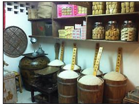
設計成雜貨店形式的展覽單位

現時無論是公共屋邨還是私人樓宇附近，都會有大型超級市場及廿四小時營業的便利店，方便居民購買日常用品及食物。然而當這些超級市場及便利店在數十年前尚未成行成市的時候，屋邨居民平日購物的地方，多為開設於邨內的雜貨店及士多。這類店鋪於今天除了在樓齡較長的公共屋邨，或是新界部分舊式墟市外，於市區已難得一見。而在「美荷樓生活館」的一樓展廳，有一個單位即設計成當年的雜貨店模樣，學生可藉此認識以往店鋪的經營情況，並可以對居民生活的影響為焦點，從不同方面（例如購物環境、便利程度、貨物種類、店員與顧客的關係）比較這些店鋪和超級市場或便利店的分別。