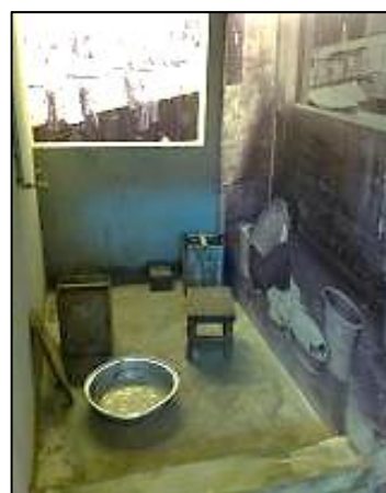
廁所旁邊的公共洗滌空間

每個人上廁所都必須走一大段路到該層的公共廁所，男廁只有三格，污穢不堪，即使大清早前往，廁坑之上早就佈滿金銀糞土。……有時遇到繁忙