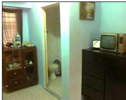
1970年代重建後的公屋單位

美荷樓落成初期，各單位均沒有獨立廚廁，居民需要在單位外的走廊生火煮食，以及使用數目不足、衛生環境惡劣及治安欠佳的公共浴廁。以下兩名居民憶述上廁所及到浴室洗澡的情況，恐非現時大部分學生可以想像：