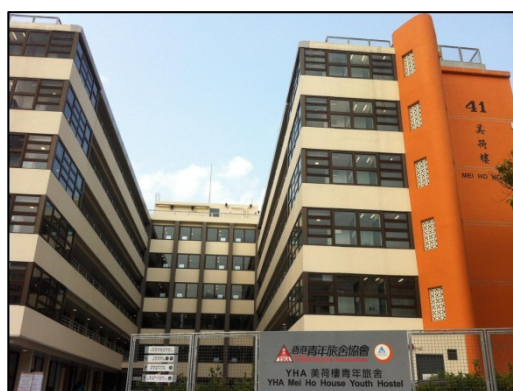
重建為青年旅舍的美荷樓