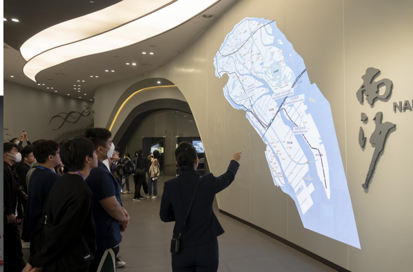
學生實地考察了解南沙的地理位置及《南沙方案》。