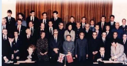
簽署促進兩年會談，中英雙方簽署成香港回歸問題聯合聲明。1984年12月19日，时任總理趙紫陽與蘇聯夫人分別代表兩國政府簽署《中英聯合聲明》。 After talks over two years, China and Britain reached an agreement on the handover of Hong Kong. On 19 December 1984, Chinese Premier Zhao Ziyang and British Prime Minister Margaret Thatcher signed the Sino-British Joint Declaration.

In accordance with the Constitution, the NPC hereby enacts the Basic Law, prescribing the systems to be practised in the HKSAR, in order to ensure the implementation of the basic policies of the PRC regarding Hong Kong.