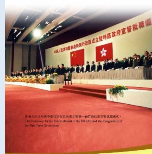
中華人民共和國香港特別行政區成立暨第一屆行政長官宣誓就職儀式。 The Ceremony for the Establishment of the HKSAR and the Inauguration of the First Term Government.

The Basic Law came into effect on 1 July 1997. The Basic Law is a national law applicable to the whole nation, including the HKSAR.