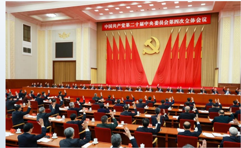
中國共產黨第二十屆中央委員會第四次全體會議，於2025年10月20日至23日在北京舉行。中央政治局主持會議。