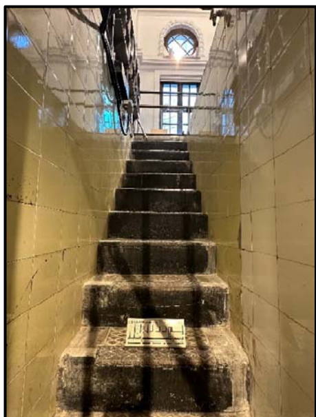
從法庭下望地下拘留室的相片