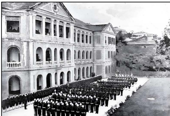
（約 1890 年的中區警署營房大樓）