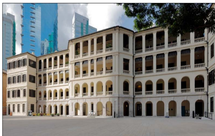
（今天所見的中區警署營房大樓）